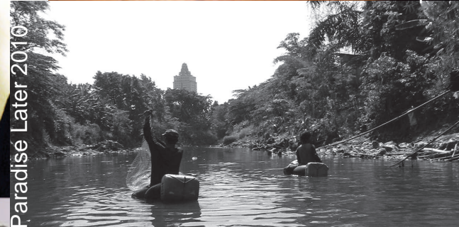
Paradise Later 2010