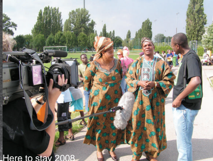
Here to stay 2008