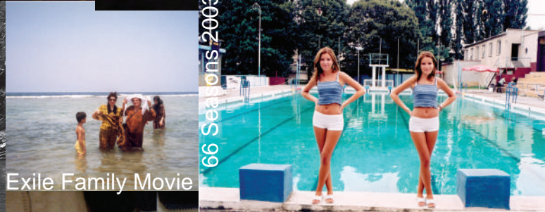
66 Seasons, 2003