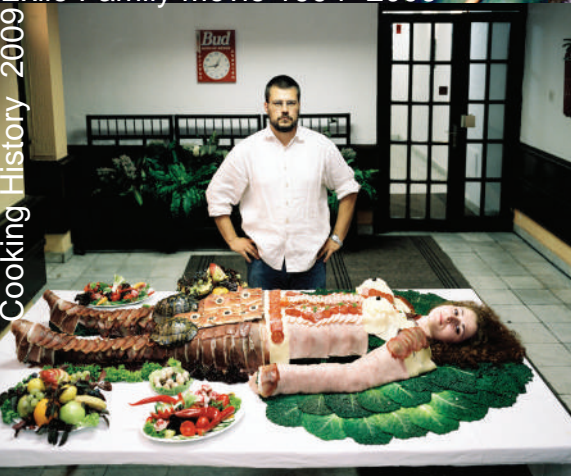
Cooking History 2009