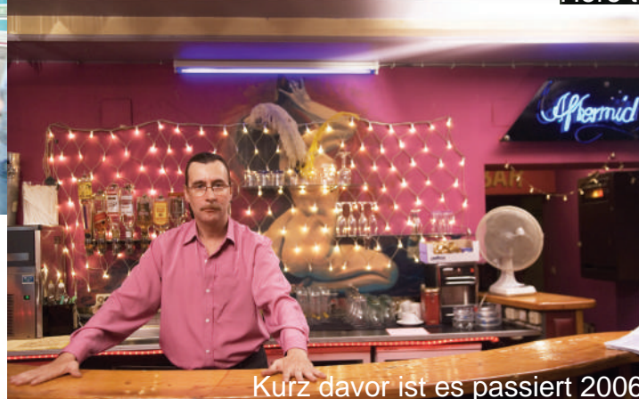
Kurz davor ist es passiert 2006