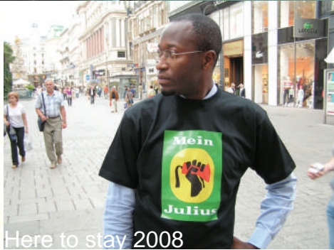
Here to stay 2008