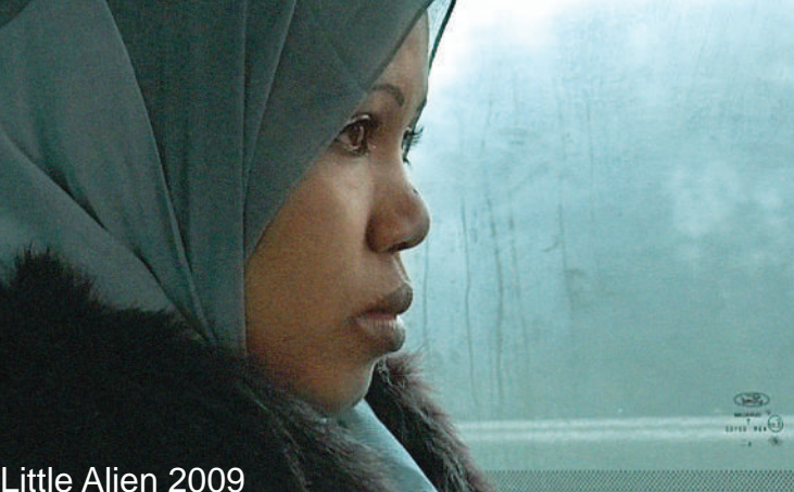
Little Alien 2009