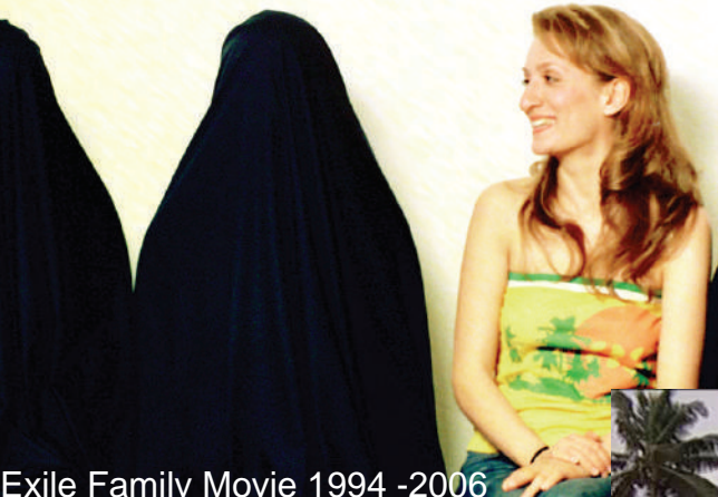
Exile Family Movie 1994 -2006