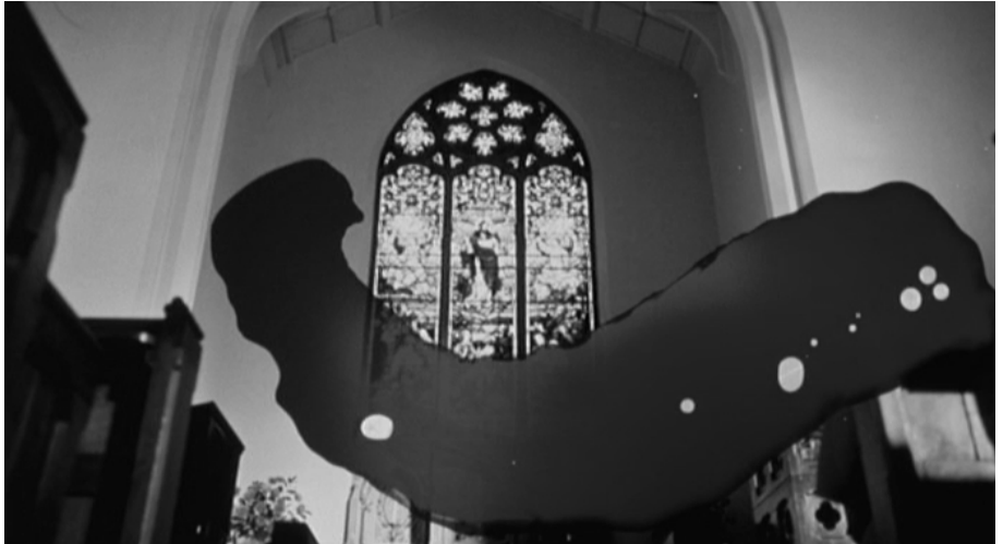
Alle Abb. aus Wenn die Gondeln Trauer tragen , Regie: Nicholas Roeg DVD-Video, Kinowelt 2001; (Orig.: Don't Look Now , IT/GB 1973).

John war – einer plötzlichen Vorahnung folgend – als erster am Todesort Christines zugegen und hat noch versucht, den leblosen Körper rechtzeitig aus dem Wasser zu ziehen. Realisierend, dass dies zu spät erfolgt, schreit der Vater mit weit aufgerissenem Mund, wobei der Ton in der zweiten Einstellung, die den Schrei zeigt, ausgespart ist.